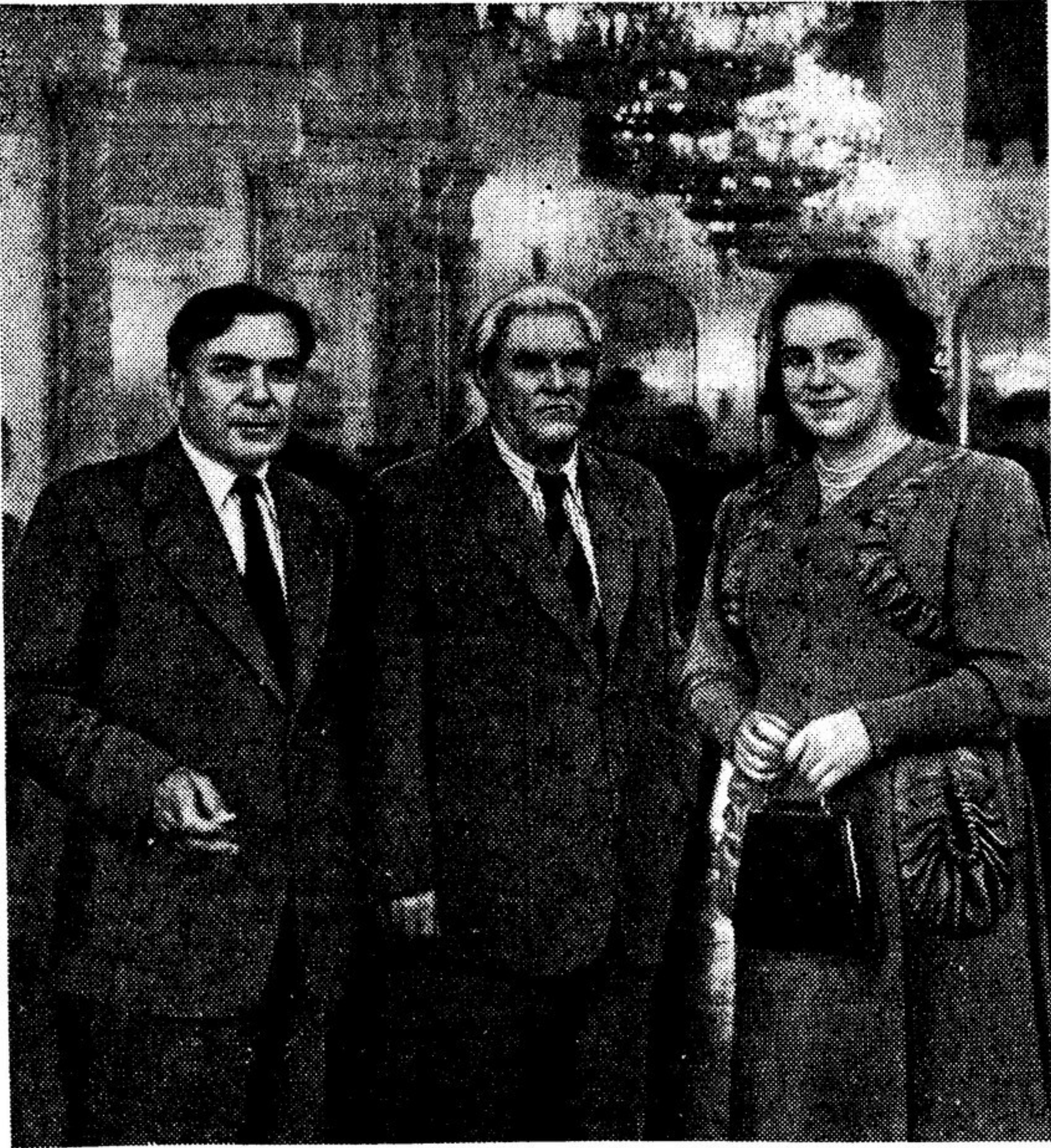
Депутаты Верховного Совета СССР (слева направо): народный артист СССР Б. Чирков, писатель Н. Тихонов и народная артистка СССР Л. Александровская в Георгиевском зале Большого Кремлевского Дворца.