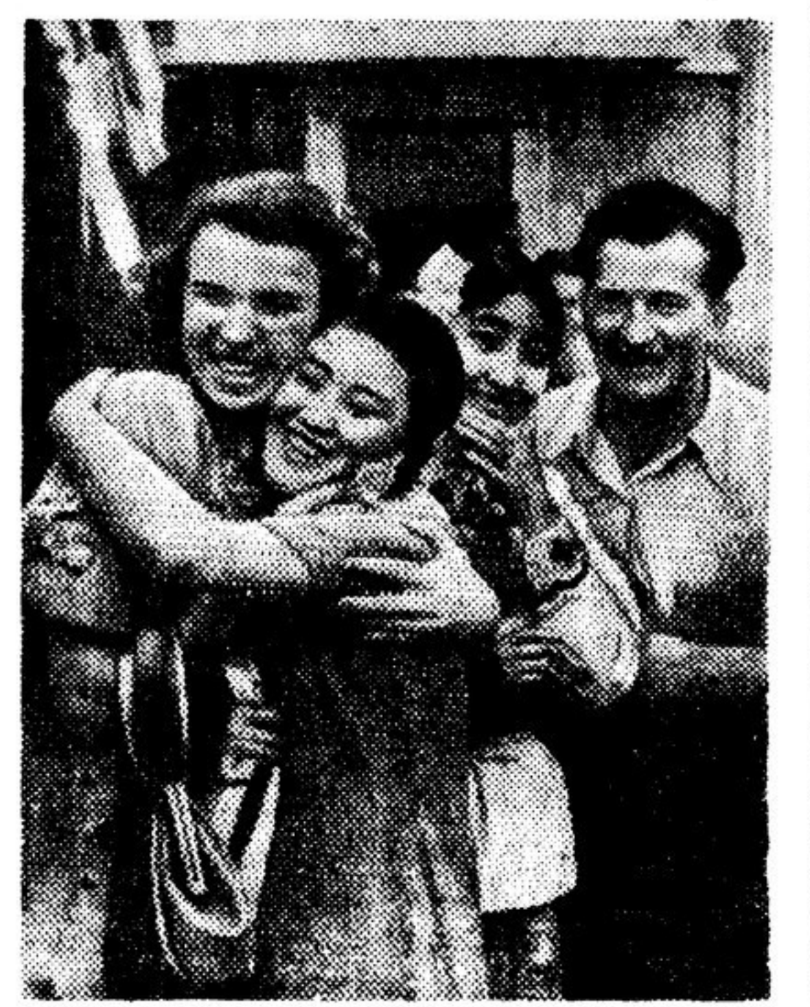
В эти дни в Бухаресте. Дружеская встреча представителей советской и китайской молодежи — участников Всемирного фестиваля.

Д.М. ЕРЕМИН, специальный корреспондент «Литературной газеты» БУХАРЕСТ, 7 августа. (По телефону)